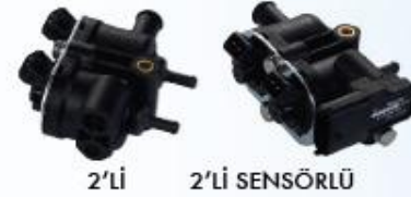
2'Lİ 2'Lİ SENSÖRLÜ

REGÜLATÖR (IG1 PRV) BEYĞİR GÜCÜ 110 KW'DAN YÜKSEK VE TURBO MOTORLU ARAÇLARDA ÜSTÜN PERFORMANS SAĞLAR.