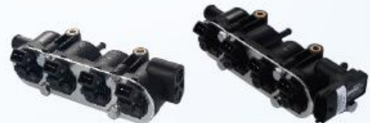
4'LÜ 4'LÜ SENSÖRLÜ

ENJEKTÖRLER YÜKSEK ÜRETİM TEKNOLOJİSİ SAYESİNDE 8000 DEVİRE KADAR TAM RANDIMANLA ÇALIŞIR.