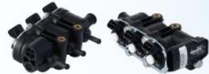
3'LÜ 3'LÜ SENSÖRLÜ