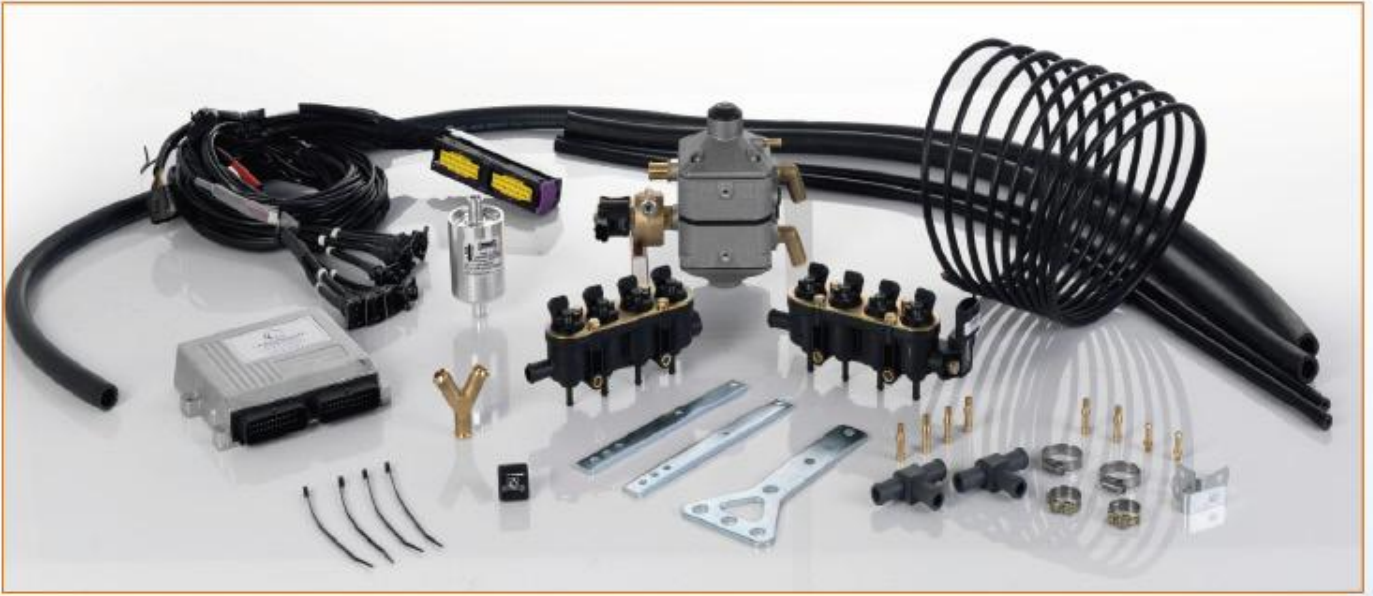
LANDIRENZO 8 SİLİNDİR KİT